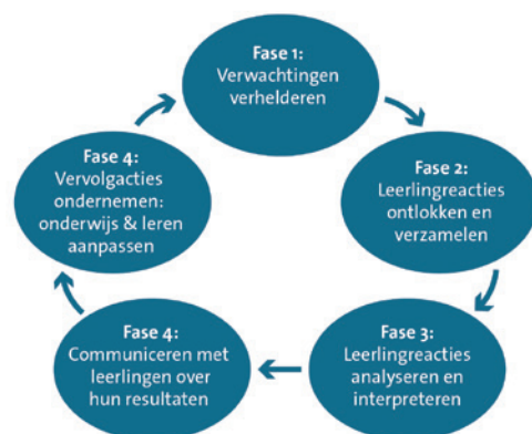
Figuur 1: De cyclus van formatief evalueren (Gulikers & Baartman, 2017)

Het proces van formatief evalueren kan worden weergegeven in een cyclus van vijf fasen (zie figuur 1). Deze fasen komen steeds (meerdere keren) terug binnen een les of lessenreeks.